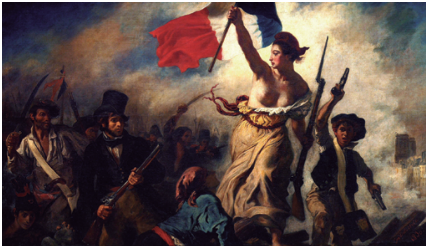
Pintura: Eugène Delacroix

Considérase un dereito o que se concede ou reconece a un suxeito, en función de circunstancias moi distintas: o nacemento, a herdanza, a veciñanza, a conquista, o traballo, etc. No caso dos dereitos humanos, a circunstancia é precisamente esa: ser unha persoa. Son, por tanto, inherentes a todos os seres humanos polo simple feito de selo, independentemente de calquera trazo diferencial: nacionalidade, lugar de residencia, sexo, orixe nacional ou étnica, cor, relixión, lingua, ou calquera outra condición. Dado que emanan da dignidade da persoa, son universais (ninguén está excluído), inalienábeis (a ningúen se lle poden arrebatarse), indivisíbeis , interdependentes , interrelacionados (non son parcelábeis nin poden ser aplicados illadamente: ningún dereito é máis importante que outro) e non condicionados (non se pode esixir ningunha clase de contrapartida). O deber correspondente a estes dereitos é o respecto e a garantía aos dereitos das outras persoas.